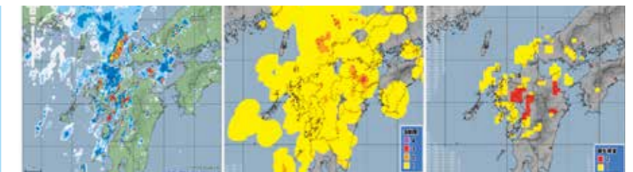
▲降水ナウキャスト ▲雷ナウキャスト ▲竜巻発生確度ナウキャスト

お問い合わせ 稚内地方気象台 ☎0162-23-2679 / 役場総務課総務係 ☎0162-82-1001