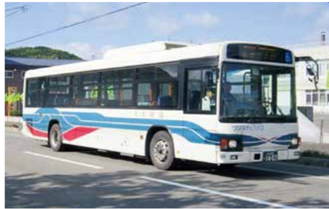
▲沿岸バス(豊富留萌線)